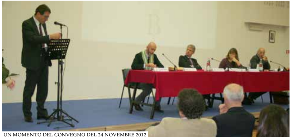
UN MOMENTO DEL CONVEGNO DEL 24 NOVEMBRE 2012

Il compleanno è stata l'occasione per salutare e ringraziare chi ha creduto nel progetto fin dall'inizio, ma anche per guardare avanti. Tanti gli obiettivi per il futuro: incrementare la promozione del prodotto Aceto Balsamico Tradizionale, sviluppare l'aspetto dinamico del Museo, ma soprattutto completarne il tra-