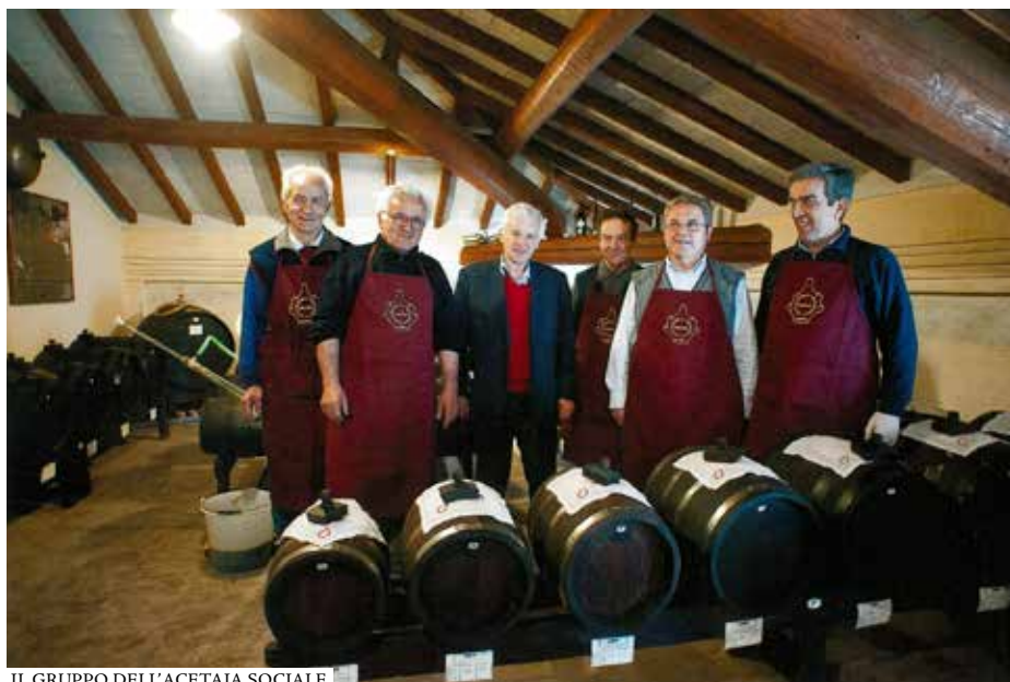
IL GRUPPO DELL'ACETAIA SOCIALE