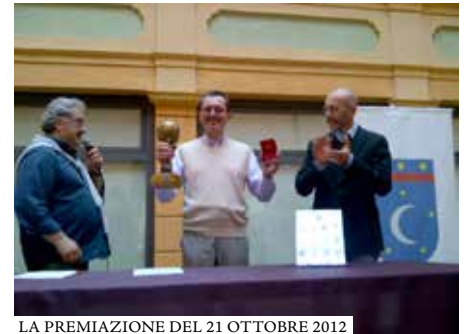
LA PREMIAZIONE DEL 21 OTTOBRE 2012

La stessa struttura del Torneo, cioè la suddivisione in quartieri e ville ed il conseguente "sistema premiante", hanno contribuito a motivare alla partecipazione di questa 'sana competizione' e al confronto leale e codificato. Ogni anno sarà premiato l'aceto balsamico tradizionale presentato per la Disfida, che tra i dodici finalisti avrà ottenuto il maggiore punteggio. Oltre alla medaglia al vincitore viene assegnato anche un premio (Trofeo) al quartiere o villa vincitore, che rimarrà esposto in vari luoghi pubblici sino alla competizione successiva. Quindi un 'premio itinerante' che segue ogni anno il vincitore. Infine, in Aceta-