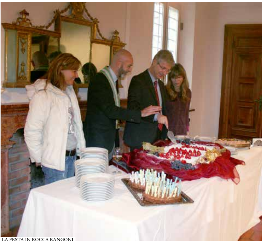
LA FESTA IN ROCCA RANGONI